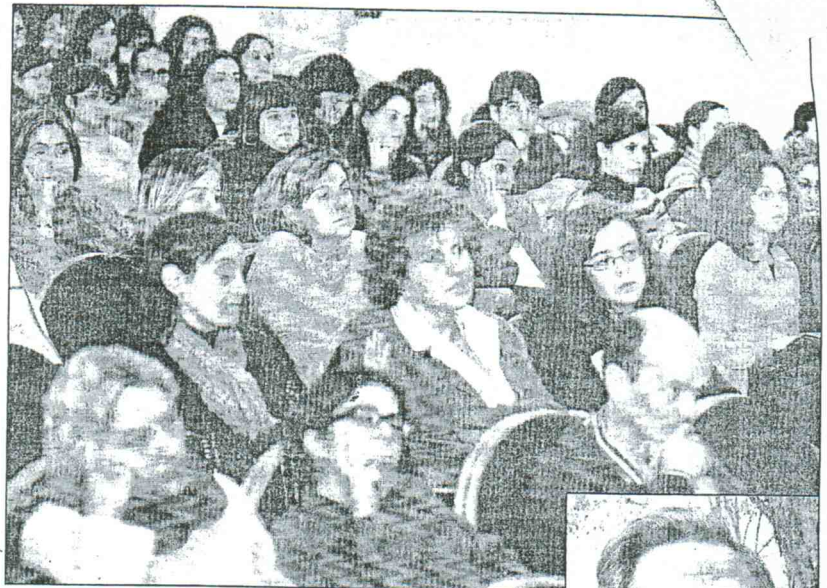
Público asistente a este congreso, en el Aula Magna Tirso de Molina