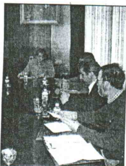
Reunión de la mesa

La alcaldesa conversó con los miembros de la mesa sobre el plan de mejoras que el Ayuntamiento está elaborando en los parajes anteriormente citados. La mesa ha expresado su deseo de colaborar en todos los proyectos