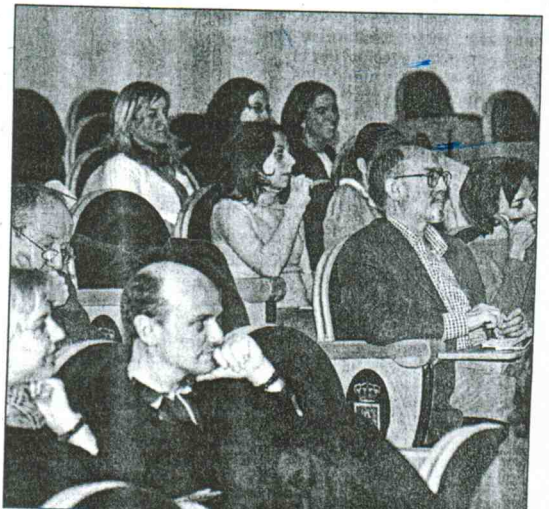
Clausura del Congreso en el Aula Magna

El objetivo de este primer simposio internacional ha sido el de suplir el vacío en cuanto a publi-